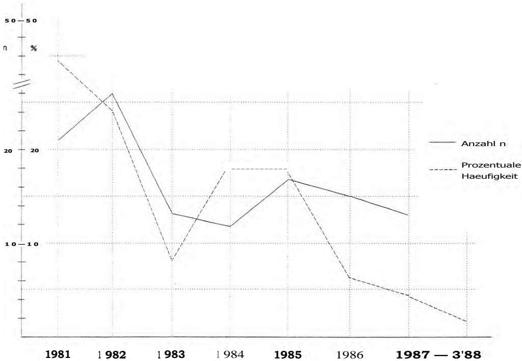
Abb. 2. Relative und absolute Häufigkeiten positiver primärer Keimanzüchtungen

Zellkulturschale wird das Gewebe in die mit einem Volumen von ca. 200 ml des gleichen Mediums gefüllte Organkulturflasche überführt. Die erste Immersionslösung wird zur mikrobiologischen Untersuchung und Keimanzüchtung eingeschickt. Die Organkulturen werden bei einer mittleren Temperatur von 32 °C gelagert.